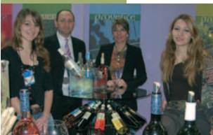
Domaine des Peirecédès