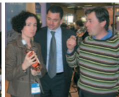
Châteaux Élie Sumeire