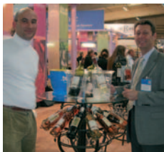
La Bastide des Bertrands